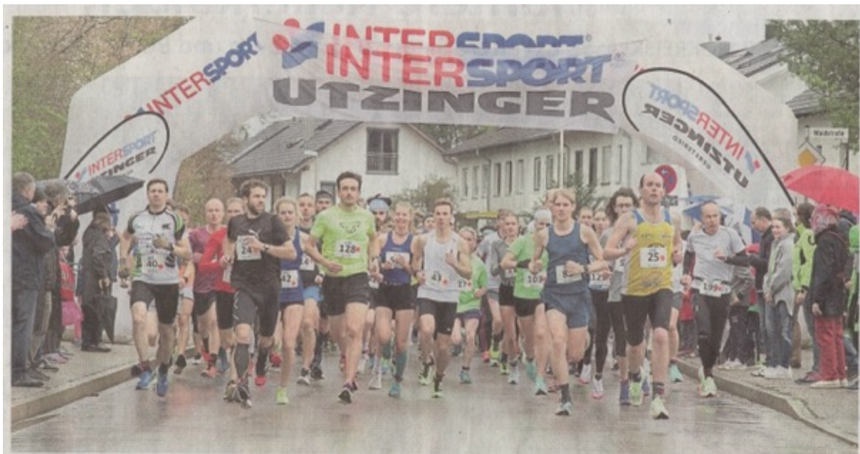
Nach zweijähriger Pause gingen bei der Auftaktveranstaltung der Raiffeisen Oberland Challenge in Geretsried am Samstag fast 500 Läuferinnen und Läufer an den Start. Das Hauptfeld musste eine Strecke von zehn Kilometern absolvieren.